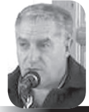
يكتبه: حسن خليفة

التآخي، متحابين كقوى ما تكون المحبة، ولقد كانوا مشتركين في أعمال عظيمة، معروضين لعواقب وخيمة، ومن شأن ما يكون