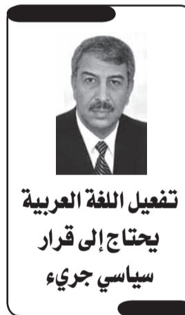
تفعيل اللغة العربية يحتاج إلى قرار سياسي جريء

في الحقيقة المشكلة في اللغة العربية ليست مشكلة داخل اللغة، إنما المشكل له علاقة باللغة مثل الجامعات والإعلام والفنون والتربية وغير ذلك، وهذا يدخل في مسألة المصطلحات، والمصطلحات ليست لغة بل هي مفاهيم وأفكار، فحينما ننتج نحن أفكاراً ومفاهيم حينها نستطيع