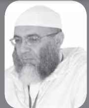
الشيخ نور الدين رزيق

وإذا نبئت فلا مستقر لها. أعلم عبد الله، أن أرض فلسطين وما حولها أرض مباركة، وصفها الله سبحانه بذلك في خمسة مواضع من كتابه، وفيها المسجد الأقصى: أولى القبلتين، وثالث المسجدين، ومسرى الرسول صلى الله عليه وسلم، افتتحها عمر بن الخطاب رضي الله عنه، وحررها صلاح الدين رحمه الله، فهي ملوكة للمسلمين، وأرضها وقف عليهم، والحق فيها لله عز وجل، ليست حقا شخصيا لأحد كائنا من كان حتى يتنازل عن شيء منها، لا يباع أصلها ولا يوهب ولا يورث.