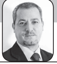
د. بدران بن الحسن*

فصل من كتابه (شروط النهضة) يحمل عنوان «من التكدس إلى البناء» لاحظ مالك بن نبي مشكلة تمثل عائقاً يعيق جهود الإصلاح والسعي لتحقيق نهضة حضارية لأمتنا، وتسبب في ضياع ميزانيات كبيرة من الوقت والإمكانات والجهود. هذا العائق يمكن أن نطلق عليه «غياب الوعي المنهجي». فبالرغم من اعتباره أن هناك جهوداً موفقة من أجل النهضة قد بذلت طيلة العقود الماضية، فإن هناك خطراً يهددها، وهو أن أغلب الجهود يغيث عنها الوعي بالمنهج، وتفتقد المنهج في السعي لتحقيق أهدافها؛ سواء في ذلك الجهود العملية أو المعالجات النظرية. يقول مالك بن نبي: «من الممكن أن نخلص الآن سجلات هذه الحقبة، ففيها كثير من الوثائق والدراسات، ومقالات الصحف، والمؤتمرات التي تتصل بموضوع النهضة. هذه الدراسات تعالج الاستعمار والجهل هنا، والفقر والبؤس هناك، وانعدام التنظيم، واختلال الاقتصاد أو السياسة في مناسبة أخرى ولكن ليس فيها تحليل منهجي للمرض، أعني دراسة مرضية للمجتمع الإسلامي، بحيث لا تدع مجالاً للظن حول المرض الذي يتألم منه منذ قرون» (شروط النهضة، ص 40).