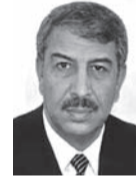
لم نتمكن بعد من تطوير تكنولوجيا خاصة بثقافتنا العربية

أما فيما يتعلق بسؤالك الثاني حول العاميات والدواجر لا أظن أنها مشكلة بالنسبة للغة العربية لأن العاميات لها نظامها الخاص بما يتعلق بالجملة وبالمفردة ولها أيضا نظامها المنطقي والبلاغي وغير ذلك، فهي لا تشكل عبئا على اللغة العربية، لكن هناك من لا يقبلها هذه هي المشكلة، فكل اللغات لها عاميات تلحق بها فمثلا اللغة الفرنسية هناك لغة شفوية يتحدثون بها وأخرى يكتبون بها، ولا نستطيع أن نفرض